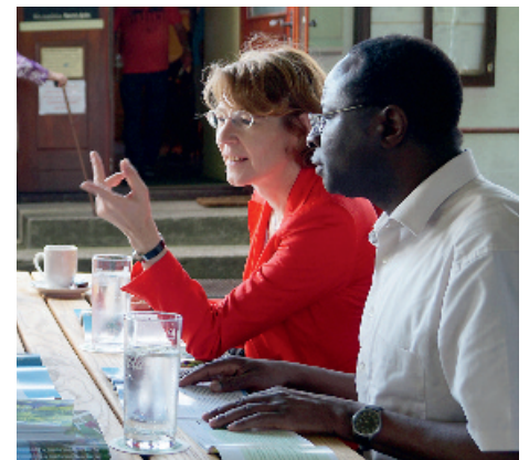
Mit MdB Karamba Diaby in Augsburg