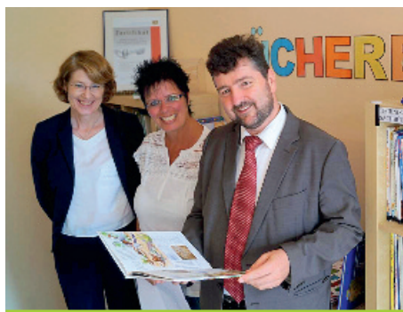
Übergabe der Sprachplakette in Oberhausen