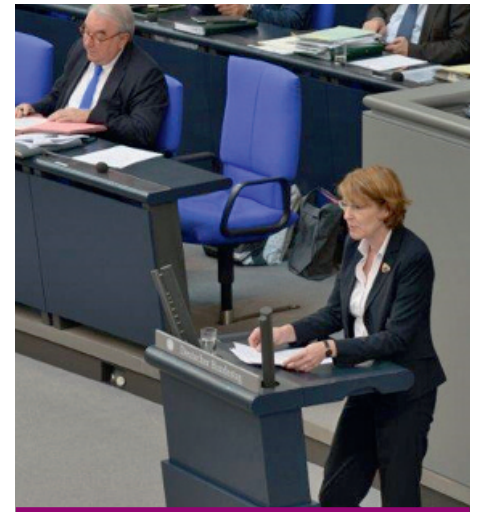
Am Rednerpult im Deutschen Bundestag

Du bist jetzt seit drei Jahren im Bundestag, eine Politikerin mit einem sehr vollen Kalender. Mit zwei Wohnungen, zwei Büros und 450 Kilometern Luftlinie,