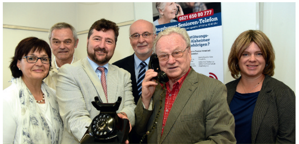
Präsentation des Seniorentelefons

Es werden wieder mehr soziale Wohnungen gebaut, aktuell entstehen 1 300 neue Wohnungen. Der Mietspiegel kommt und wird dafür sorgen, dass die Mietpreisentwicklung transparen-