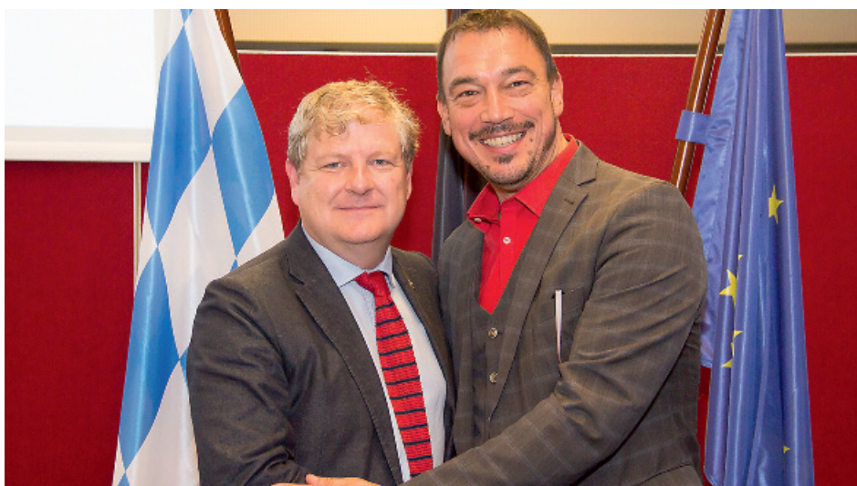
Schwäbisch-schottischer Schulterschluss mit Angus Robertson

Auf meine Anregung hin war er unser Gast bei der Herbstklausur der Landtagsfraktion und so konnten wir die guten Beziehungen zwischen der bayerischen und schottischen Sozialdemokratie pflegen. Schottlands Ziel sei es, in der Europäischen Union zu bleiben, so Angus' klare Botschaft. Er halte es daher für wahrscheinlich, dass ein erneutes Referendum zur Unabhängigkeit Schottlands abgehalten werde. Die Verhandlungen mit Brüssel seien bereits angestoßen, nun gelte es abzuwarten: Wann wird der Brexit tatsächlich in die Wege geleitet und wie wird das Ganze ablaufen? Wir werden sehen!