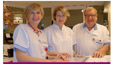
Als Praktikantin im Vincentinum