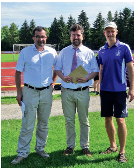
Besuch beim Fußballturnier