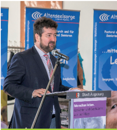
Eröffnungsrede Vernissage zum Tag der Pflege

Seit die SPD in Augsburg kommunalpolitische Verantwortung trägt – also seit über 100 Jahren – sind soziale Themen ein Kernstück ihrer Arbeit. Dass die SPD seit ihrer erneuten Regierungsbeteiligung 2014 auch das städtische Sozialreferat wieder besetzt, war eine Selbstverständlichkeit – und es ist zugleich eine Chance. Nirgends sind mehr konkrete Verbesserungen für Menschen möglich, die Unterstützung nötig haben. Nirgends zeigt sich aller-