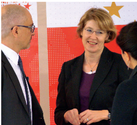
Gespräch mit Europaabgeordneten