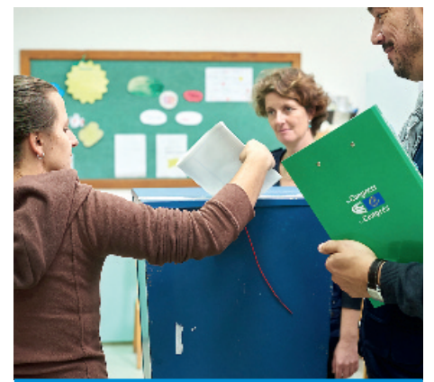
Heitere, rührende und ernste Momente bei der Wahlbeobachtung in Bosnien-Herzegowina