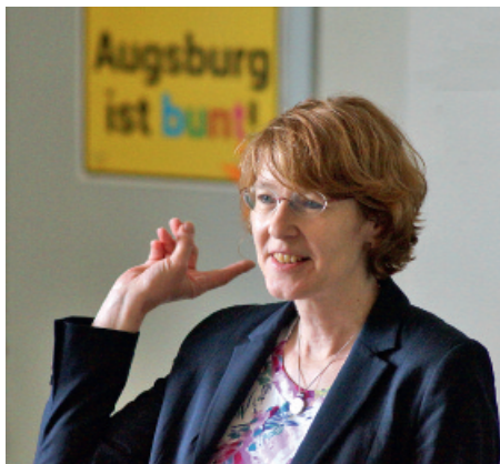
Besuch in der Berufsschule IV