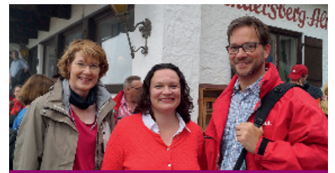
Bergauf-Tour mit Andrea Nahles und Florian Pronold