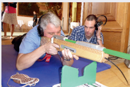
Nach Gehör schießen, ohne das Ziel sehen zu können, ist nicht leicht

Sport zu treiben verbindet Menschen, solche mit Behinderung und solche ohne Behinderung. Sich zusammen zu bewegen, ist die einfachste Art, miteinander ins Gespräch zu kommen und voneinander zu lernen. Deshalb haben wir in diesem Jahr die Sportkonferenz der SPD-Landtagsfraktion unter das Motto „Wir bewegen Bayern. Für mehr