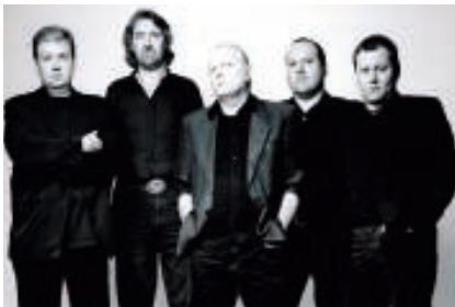
Salvation Road – www.salvation-road.de

Samstag, 28. Februar 2009, von 12 bis 16 Uhr, Rathausplatz