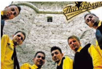
Tha Gipsys – www.tha-gipsys.de