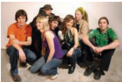
dub á la pub – www.dubalapub.de