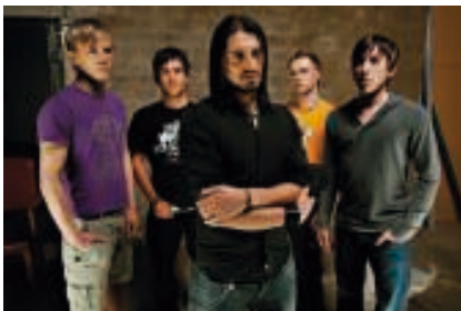
Purblind – www.purblind.de